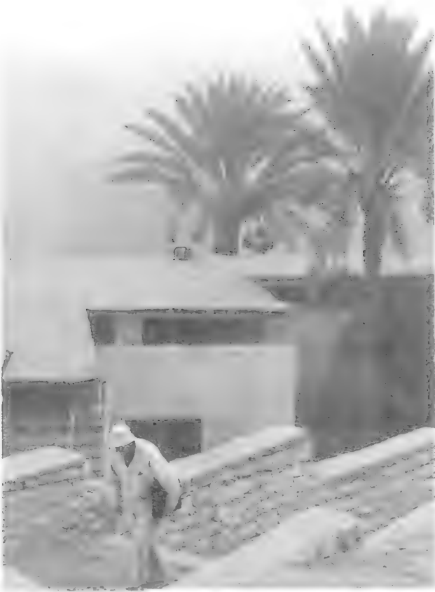
لوير يصعد سلالم منزله بسقارة